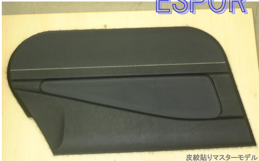
皮紋貼りマスターモデル