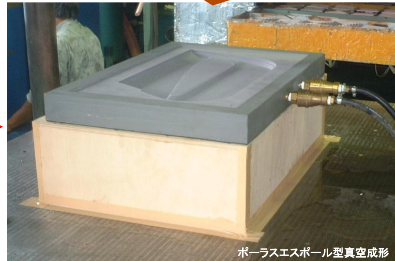
ポーラスエスポール型真空成形