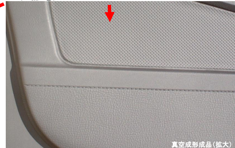
真空成形成品(拡大)